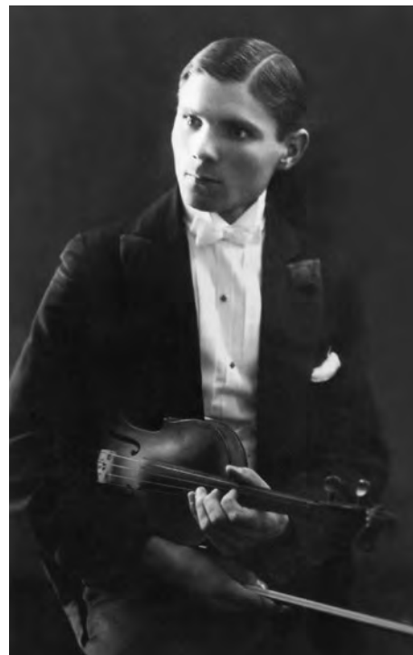
3. attēls. Teodors Kaizers. 1928. gads. Rakstniecības un mūzikas muzejs, RTMM 831435\83