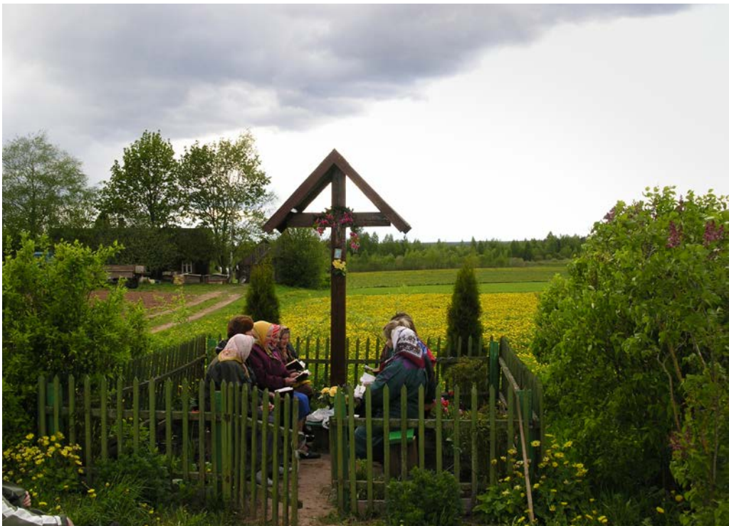
Maija dievkalpojums Bērzpils pagasta Augstaros 2004. gada 22. maijā.