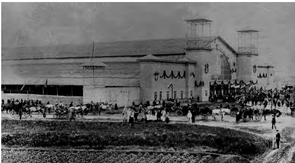
2. att. Svētku ēkas sānskats. ĢEJVM, plgk. 8866/7.