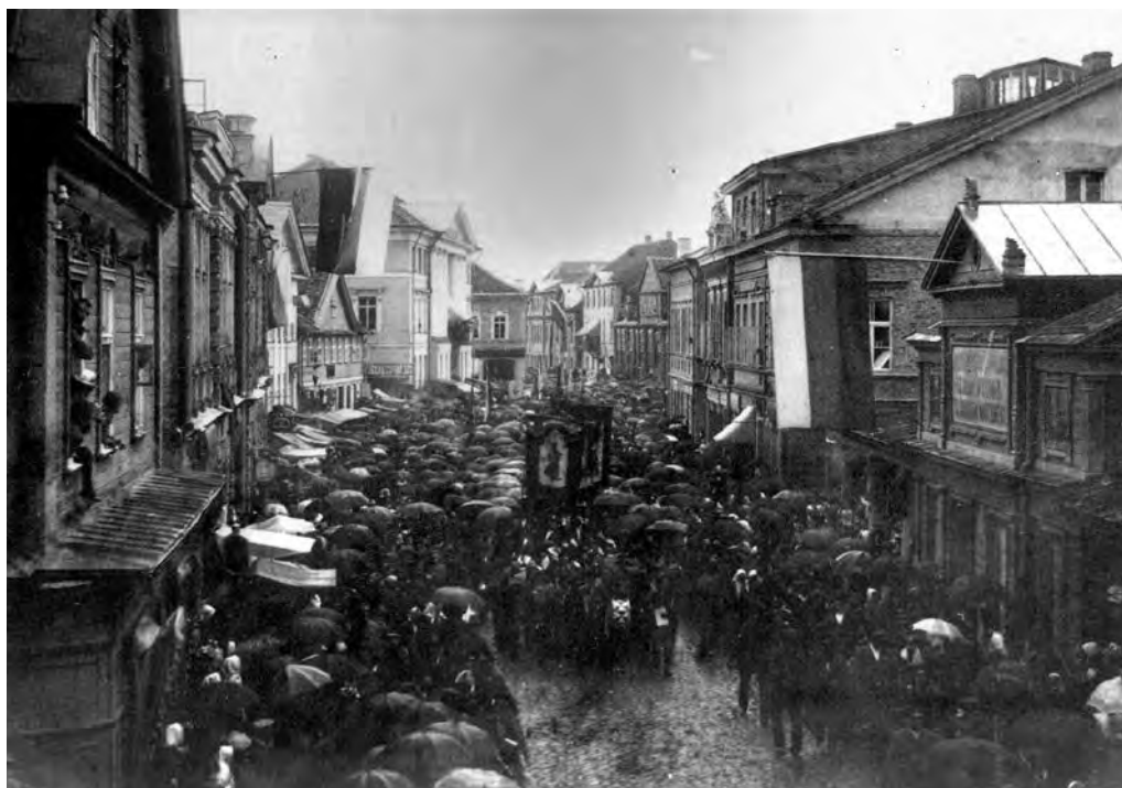
4. att. IV dziesmu svētku gājiena priekšgājēji. JVLMA JVpi, bez šifra.