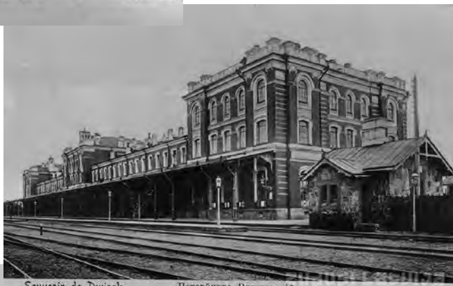
2. att. Dinaburgas/Dvinskas dzelzceļa stacija Pēterburgas– Varšavas līnijā (Pēterburgas stacija), uzcelta 1878. gadā, 20. gs. 30. gados ēka tika daļēji demontēta, 1944. gadā Vācijas karaspēks atlikušo ēkas daļu uzspridzināja.