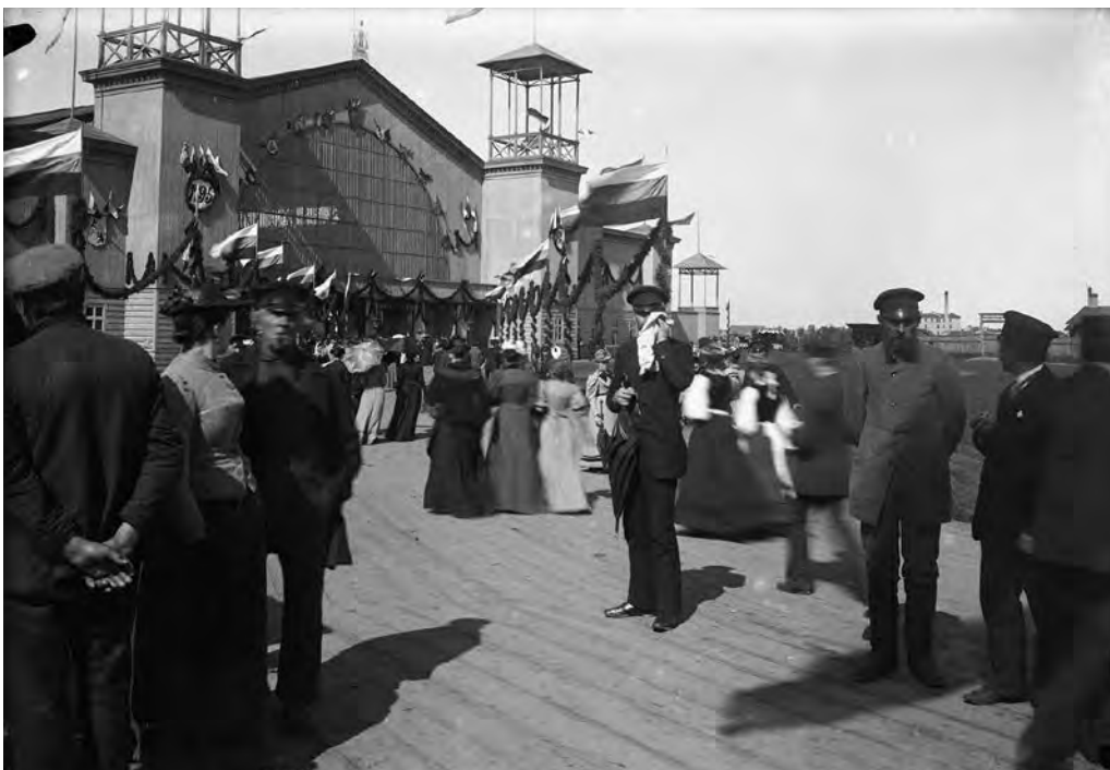
6. att. Svētku dalībnieki pie IV Vispārīgo latviešu Dziesmu un Mūzikas svētku norises paviljona Jelgavā. 1895. gada jūnijs. Neg. Nr. 37201.