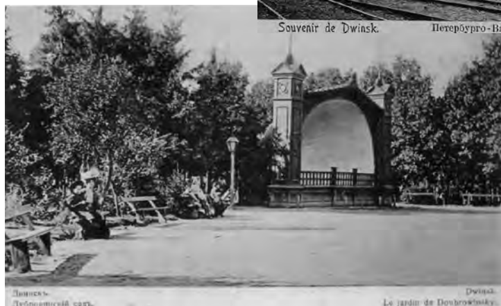
3. att. Dinaburga/Dvinska 20. gadsimta sākumā, Dubrovina dārzs.