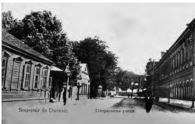
1. att. Dinaburga/Dvinska 20. gadsimta sākumā, Teātra iela.