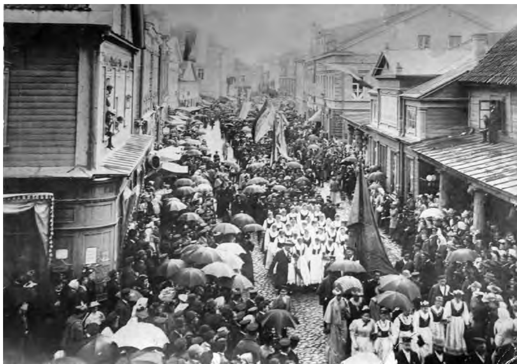
5. att. IV dziesmu svētku dalībnieku gājiens. ĢEJVM, JVMM-2280.