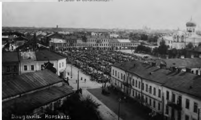
4. att. Dinaburga/Dvinska 20. gadsimta sākumā, Aleksandra laukums, redzama arī Svētā Nevas Aleksandra pareizticīgo katedrāle. 1937. gadā šajā laukumā tika uzbūvēts Vienības nams. Pēc Otrā pasaules kara, PSRS okupācijas periodā 1969. gadā katedrāle pēc pilsētas pārvaldes lēmuma tika uzspridzināta. 2002. gadā katedrāles vietā blakus Vienības namam tika uzcelta un 2003. gadā iesvētīta Nevas Aleksandra pareizticīgo piemiņas kapela.