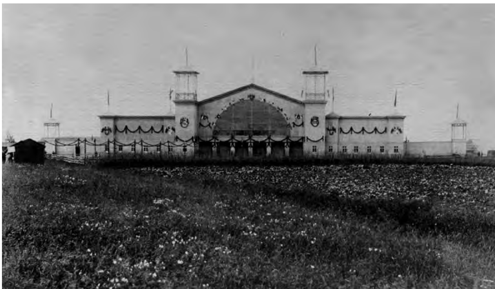
1. att. Svētku ēkas pretskats. ĢEJMMM, plgk. 8865/5.