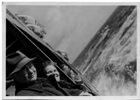
1947. gadā kopā ar māti ceļā uz Venecuēlu