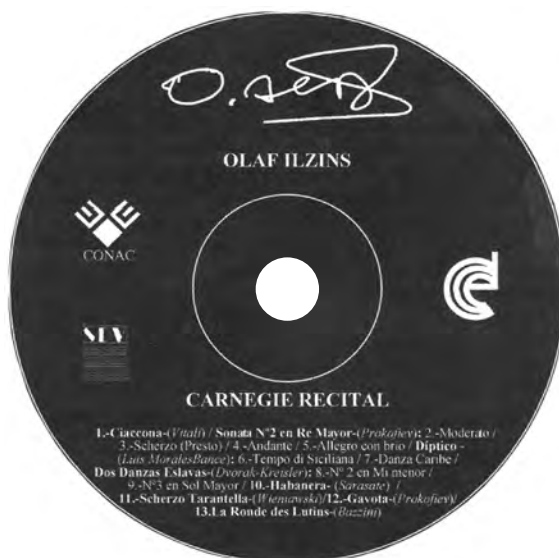
1983. gadā izdots O. Ilziņa CD