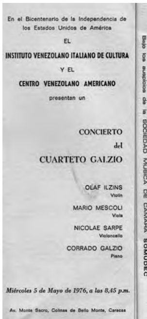
Quarteto Galzio koncerta programma