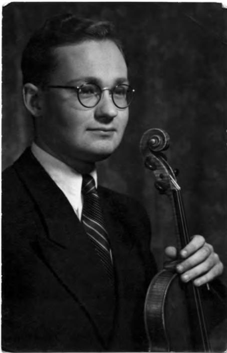
Olafs Ilziņš 1943. gadā