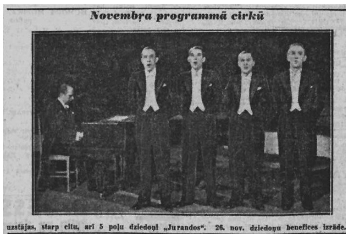
5. attēls. Ansamblis 5 Jurandi. Laikraksts Jaunākās Ziņas (sludinājums). 1936. gada 24. novembris, 16. lpp.